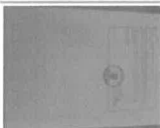
Naškol Ugovora o najmu (1).jpg 2946K